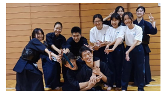
お二人の指導のもと成長を 続ける生徒のみなさま

○ お二人の指導者がいることで、それぞれ違う視点からアドバイスをいただける環境があります。いただいたアドバイスのおかげで剣道に対する視点や考え方が変わり、自分自身も成長できたと思います。先生方や先輩たちは、剣道勉強・生活面などいろいろな面で支えてくださるので本当にありがたいです。