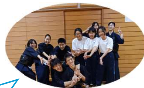
参加生徒のみなさま

自分の思い通りにいかない時に、同級生や先生たちからのアドバイスで「もう一度やってみよう！」と頑張ることができ、大会で入賞することができました！