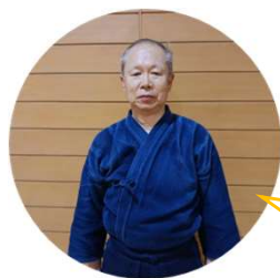
指導者 (部活動指導員と兼業)

安全面を第一 に、地域クラブ活動の趣旨を理解し、我々指導者・保護者・TEPROの 3者の連携 を大切にしています。忙しい顧問の先生の業務を少しでも減らせるように、カバーできたらと思います。文武両道で本当に素晴らしい生徒達です。