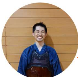
顧問の先生 (地域クラブ活動と兼業)

忙しい毎日の中で、TEPROコーディネーターや指導者の方に生徒たちを安心してお任せすることができ、 学校業務に専念 できるためとてもありがたいです。地域クラブ活動導入当初は、自分が指導に関われなくなるのではないかと心配もありましたが、今では地域クラブ活動のおかげで、 これまで以上にメリハリを持って生徒に関わり、指導 できるようになりましたと感じています。