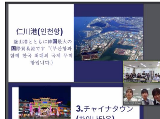
↑ 韓国側のスライド