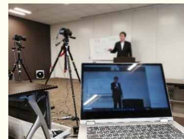
学校説明会の配信支援