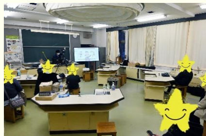
小学校・ハイブリット講座