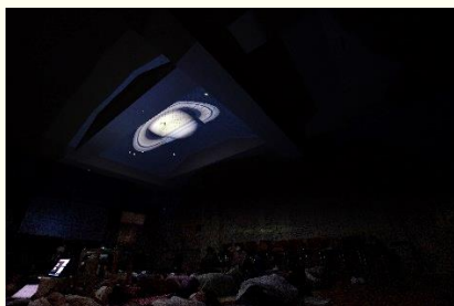
小学校普通教室・天井プラネタリウム